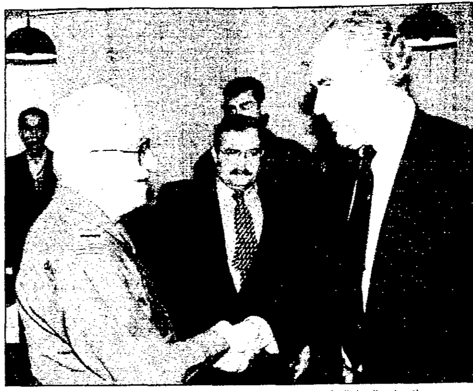
نائب رئيس الوزراء العراقي طارق عزيز يصافح رئيس اللجنة الخاصة في بغداد (اسم روبرتس)

بغداد - من دونيك أيفانز: اتفق وفد من الامم المتحدة لنزع اسلحة العراق مع مسؤولين عراقيين أمس الثلاثاء على استخدام خبراء لاجراء تحقيقات فورية في نزع فتيل الأزمة.